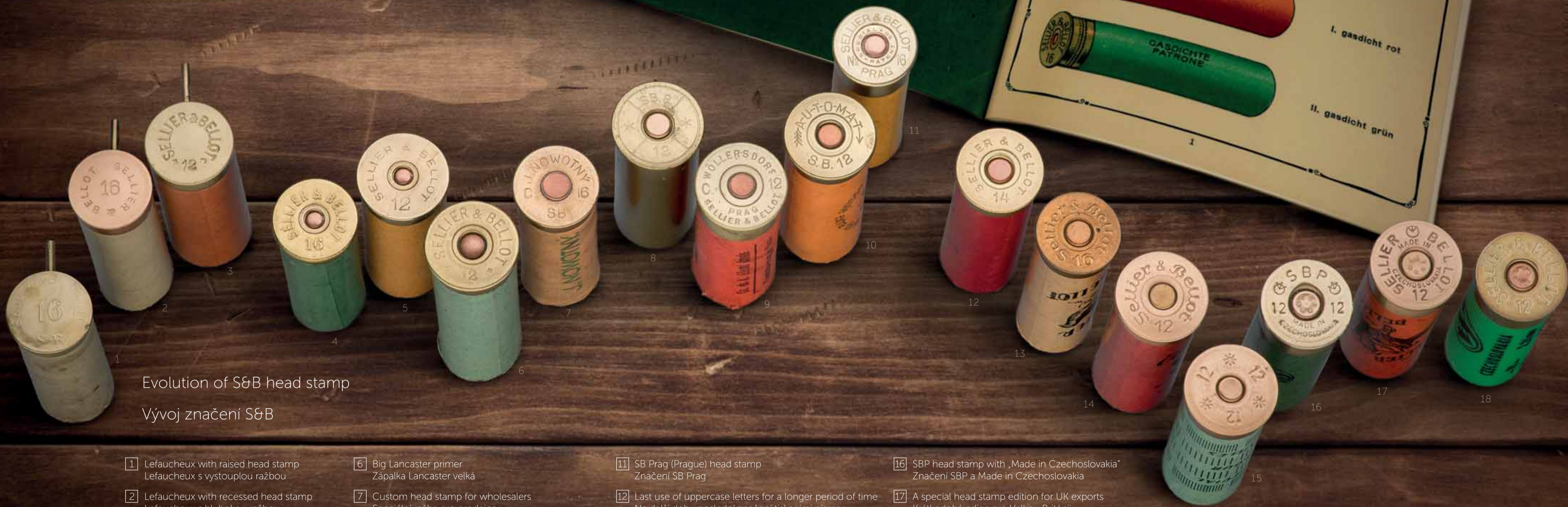
Evolution of S&B head stamp Vývoj značení S&B

1 2 3 4 5 6 7 8 9 10 11 12 13 14 15 16 17 18 19 20 21 22 23 24 25 26 27 28 29 30 31