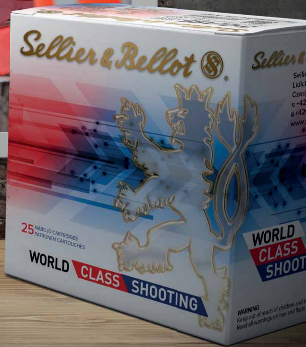
Modern shotgun shells for target shooting Moderní sportovní brokové náboje